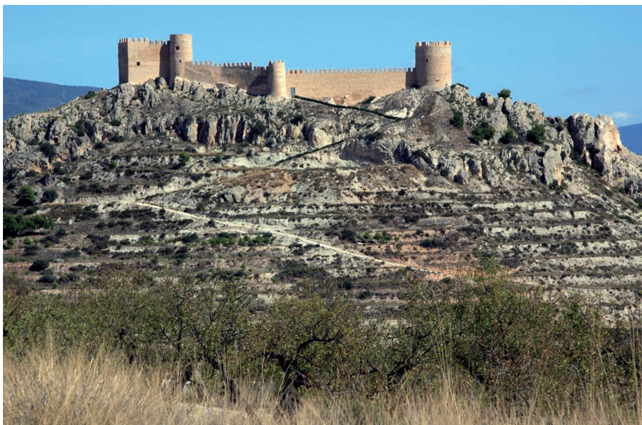
Fotografías de José Vicente Rodríguez.